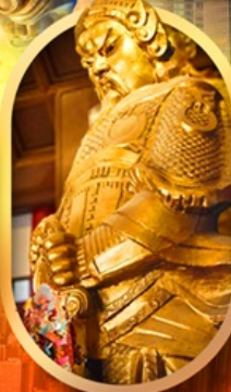
ทอพรวัดแซง