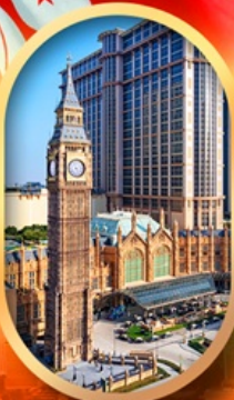
ลอนดอนเนอส์

เที่ยวคุ้ม!! บินเข้าฮ่องกง กลับมาเที่ยว บินเข้ากลับดี