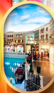
เดอะเวนิเซียน