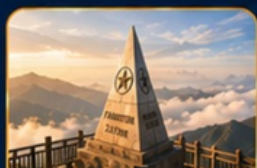
เขาฟานซิปิน (Option)