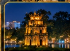
ทะเลสาบคินตาว