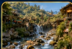
หมู่บ้านก๊ต ก๊ต