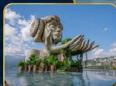
โมอาน่า ซาปา