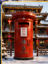
ไปรษณีย์หมู่บ้านหิมะ