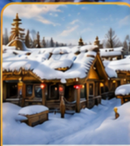
พิพิธภัณฑ์หมู่บ้านหิมะ