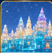
เทศกาลแกะสลักน้ำแข็ง