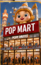
POP MART SHOP