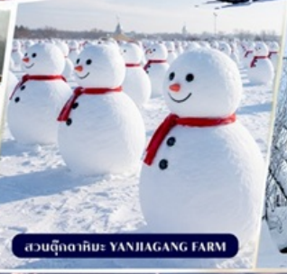
สวนฤดูหนาว YANJIAGANG FARM