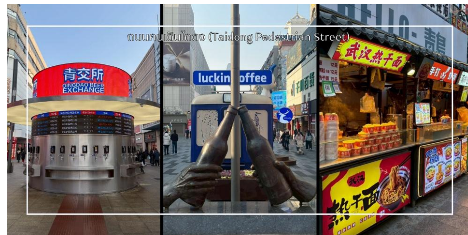
ถนนคนเดินไทตง (Taidong Pedestrian Street)

นำท่านอิสระช้อปปิ้งและเพลิดเพลิน ถนนคนเดิน ไถตง (Taidong Pedestrian Street) ย่านการค้าขนาดใหญ่ใจกลางเมือง ชิงเต่า (Qingdao) ที่คึกคักและเต็มไปด้วยสีสันแห่งชีวิตประจำวัน ถนนแห่งนี้เป็นแหล่งรวมสินค้าแฟชั่น แบรนต์ ท้องถิ่น ร้านอาหาร คาเฟ่ และร้านของฝากมากมาย เหมาะสำหรับนักท่องเที่ยวที่ต้องการสัมผัสวิถีเมืองและเลือกซื้อของที่ระลึกกลับบ้าน