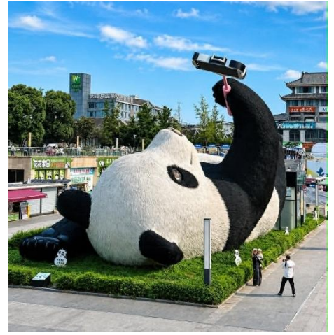
วัดต้าสือ (Daci Temple)

เดินทางสู่อีก 1 จุดเช็คอิน ที่ไม่ควรพลาดของเมืองตูเจียงเยียน จัตุรัสหย่างเทียนวู (Yangtianwo Square) เป็นจุดถ่ายรูปยอดนิยมซึ่งท่านจะได้ชมประติมากรรมรูปปั้น หมีแพนด้าเซลฟี่ (Selfie Panda) หมีแพนด้าตัวใหญ่ที่กำลังนอนหงายเซลฟี่ ณ ใจกลางจัตุรัสหย่างเทียนวู เป็นภาพแสนน่ารักซึ่งอันจะทำให้เราหลงไหลและไม่พลาดที่จะถ่ายรูปคู่เป็นที่ระลึกกันเลยทีเดียว จากนั้นนำท่านเดินทาง เทียวชม วัดต้าสือ (Daci Temple) คือวัดพุทธนิกายมหายานที่มีชื่อเสียงโด่งดังและเก่าแก่ที่สุดแห่งหนึ่งในภูมิภาคตะวันตกเฉียงใต้ของจีน มีประวัติศาสตร์อันยาวนานกว่า 1,600 ปี วัดต้าสือ มีสถาปัตยกรรมจีนแบบดั้งเดิมที่สวยงาม โดยมีอาคารและโครงสร้างที่สร้างขึ้นจากไม้และอิฐ มีหลังคาสูงและตกแต่งด้วยลวดลายที่ละเอียดบริเวณรอบๆ วัดมีสวนและพื้นที่สีเขียวที่สวยงาม นักท่องเที่ยวสามารถเดินเล่นและสัมผัสกับความงามของธรรมชาติได้