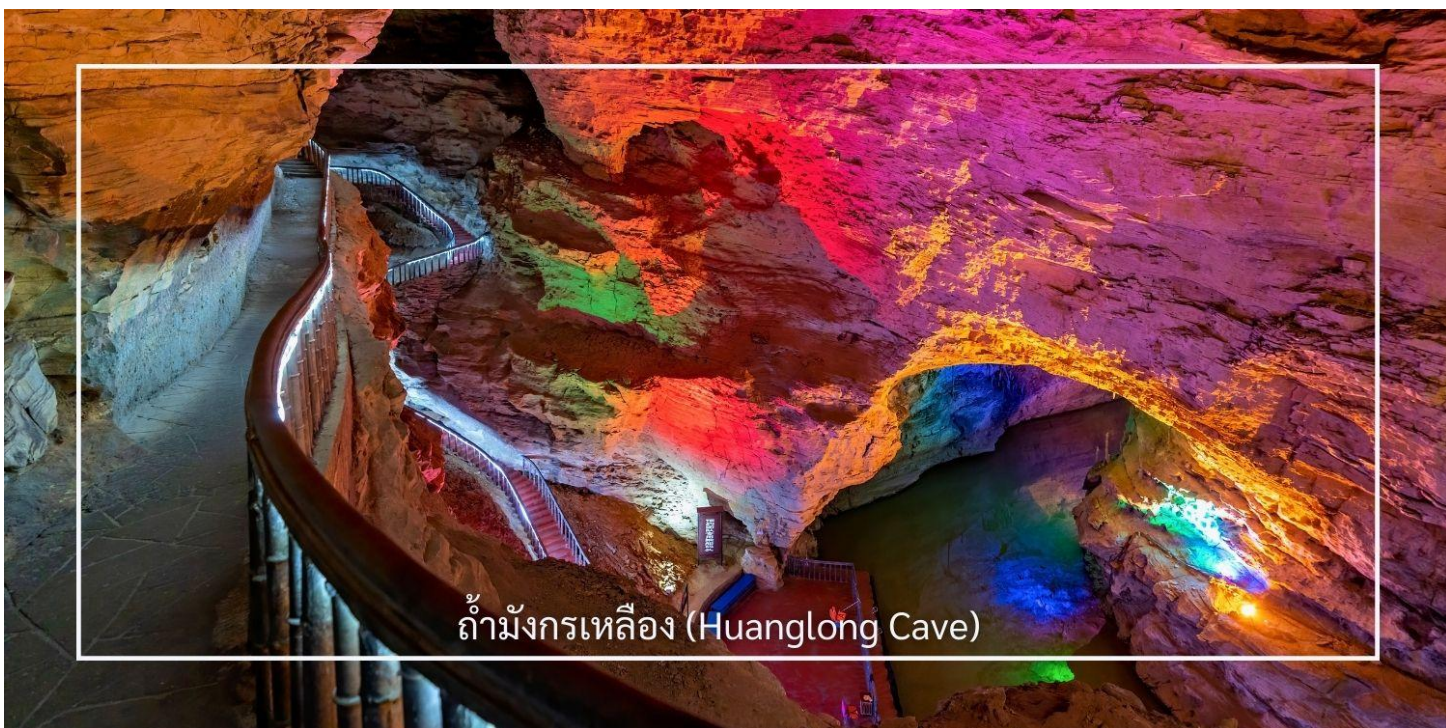
ถ้ามังกรเหลือง (Huanglong Cave)

ถ้ามังกรเหลือง หนึ่งในถ้ำหินงอกหินย้อยที่ยิ่งใหญ่และงดงามที่สุดของเมืองจางเจียเจี๋ย แหล่งท่องเที่ยวทางธรรมชาติที่ได้รับการยกย่องว่าเป็น “พระราชวังใต้พิภพ” แห่งดินแดนอุหลิงหยวน ถ้ำแห่งนี้มีโครงสร้างขนาดใหญ่ แบ่งออกเป็น 4 ชั้น ภายในประกอบด้วยห้องโถงกว้างใหญ่ ลำธารใต้ดิน บึงธรรมชาติ และแนวระเบียงหินที่ทอดยาวอย่างน่าตื่นตา ความมหัศจรรย์ของหินงอกหินย้อยซึ่งก่อตัวสะสมมาเป็นเวลาหลายล้านปี ได้รับการจัดแสงอย่างสวยงาม ช่วยขับเน้นรูปร่างแปลกตาให้โดดเด่น ราวงานศิลป์จากธรรมชาติ สัมผัสประสบการณ์ ล่องเรือชมแสงสีภายในถ้ำ โดยเรือจะนำท่านลัดเลาะไปตามสายน้ำใต้ถ้ำให้ท่านได้สัมผัสกับความยิ่งใหญ่ของธรรมชาติอันน่าอัศจรรย์ได้อย่างใกล้ชิด