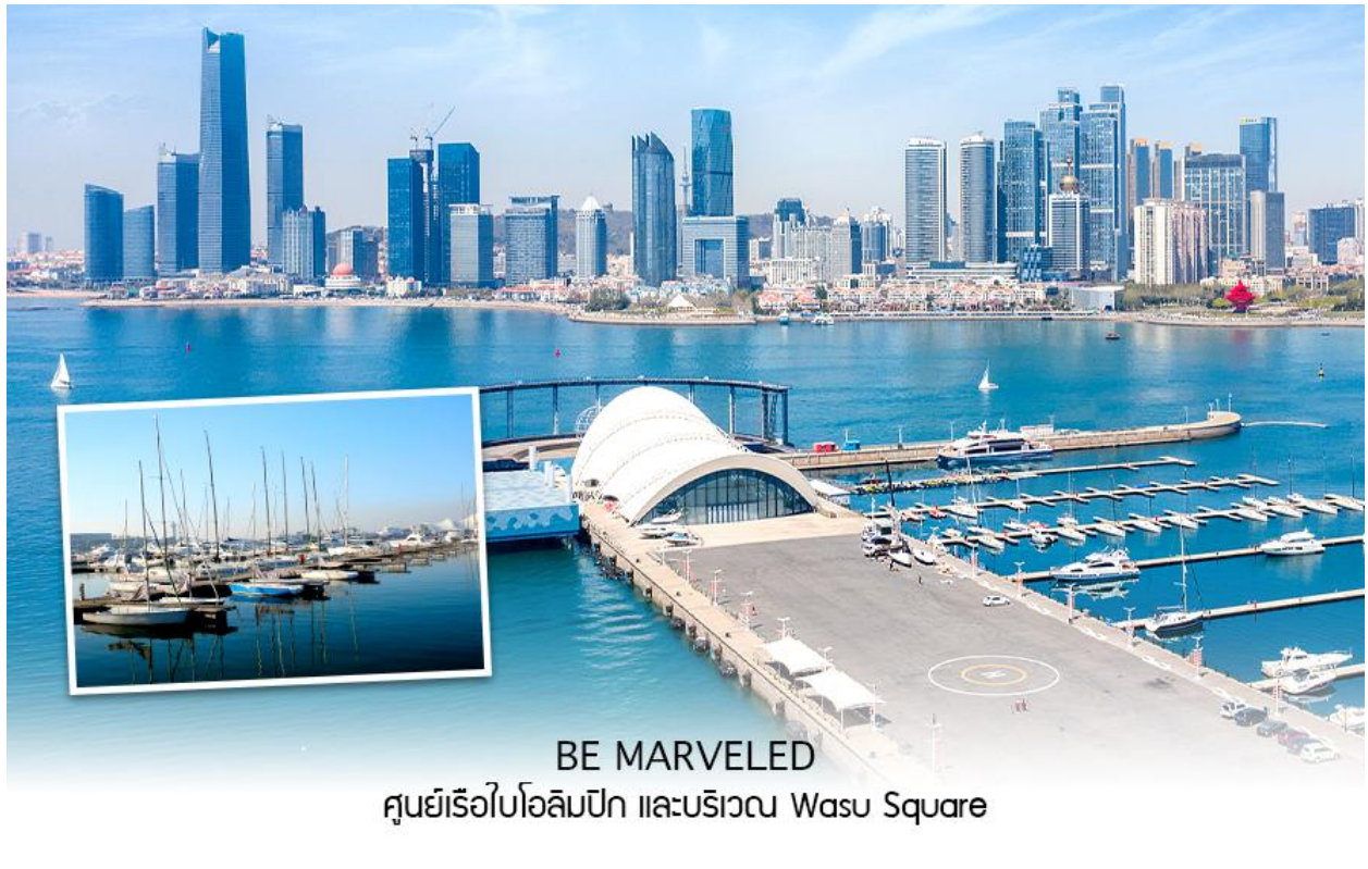
BE MARVELED ศูนย์เรือใบโอลิมปิก และบริเวณ Wasu Square

จากนั้นนำท่านไป ถนนคนเดินสไตล์เยอรมัน การผสมผสานของวัฒนธรรมจีนและเยอรมันเหมือน เดินเล่นอยู่ในยุโรป บรรยากาศดี คึกคัก โดยเฉพาะช่วงเวลากลางคืน สามารถช้อปปิ้ง ถ่ายรูปเล่นได้