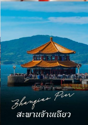
Zhangjiao Pier สะพานจ้านเจียว