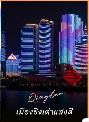
Qingdao เมืองชิงเต่าแสงสี