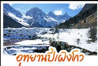
อุทยานปีศาจโกว

หมีแพนด้าอนุเชลฟี • สะพานโบราณหนานเฉียว • ภูเขาหิมะวาวู เมืองโบราณกวนเซี่ย • อุทยานปีศาจโกว • อุทยานต้ากู่ปิงชว่น ยอดเขาจ้อไบ๊ • วัดเป่ากั๋ว • ล่องเรือชมมรดกโลกหลวงพ่โตเล่อซาน วัดต้าเฉียว • ถนนไท่กู่หลี่ • ถนนชุนชี่ตู้ • ถนนโบราณชอยกว้างชอยแคบ