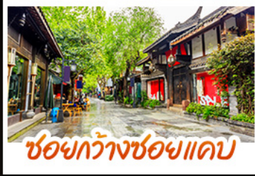
ชอยกวางชอยแปด