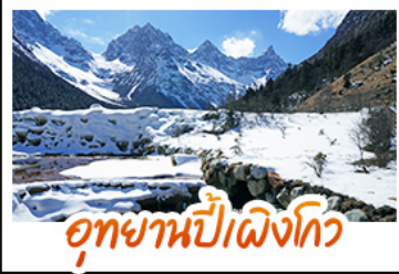
อุทยานปีศาจโกว

หมื่นพันล้านออนเซล์ • สะพานโบราณหนานเฉียว • ภูเขาหิมะวาวู เมืองโบราณกวนเซี่ยน • อุทยานนิงโกว • อุทยานต่ากู่ปิงชวน ยอดเขาจ้อไบ๊ • วัดเป่ากั๋ว • ล่องเรือชมมรดกโลกหลวงพ่โตเล่อซาน วัดต้าเจี๋ย • ถนนไท่กู่หลี่ • ถนนซุนซีลู่ • ถนนโบราณชอยกวางชอยแปด