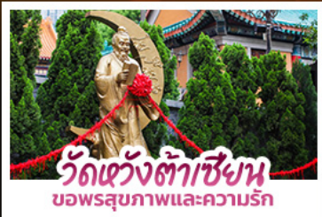
วัดแห่งตำนาน ขอพรสุขภาพและความรัก