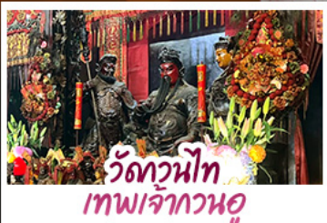
วัดหนิโท เทพเจ้ากวนอู