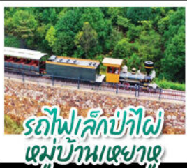
รถไฟเล็กป่าไผ่ หมู่บ้านหยงฮู