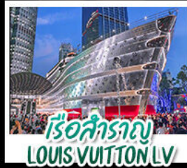
เรือสำราญ LOUIS VUITTON LV