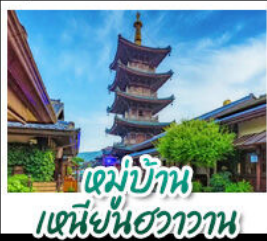
หมู่บ้าน เหนียนฮวงวาน