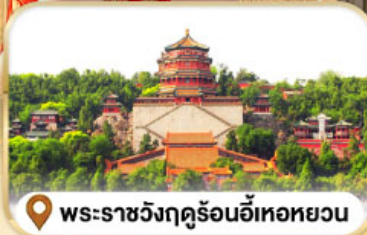
📍 พระราชวังฤดูร้อนอ้อเหอหยวน