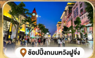
📍 ซุปpingถนนหวงฝูจิ่ง