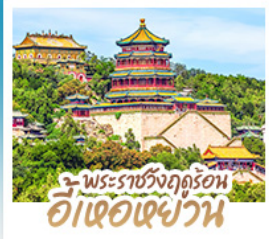
พระราชวังฤดูร้อน อี่เซวี่ยน

ทริปเดียวเที่ยว 2 เมือง ปักกิ่ง-ต้าเหลียน • เที่ยวจีนฟีลยุโรป ณ เมืองเวนิสแห่งต้าเหลียน • สัมผัสประสบการณ์ขึ้นกำแพงเมืองจีน ด่านจวิ๊ยกกวน • ช้อปปิ้ง ซิม ซิล ที่ถนนโบราณตงกวนและย่านซานหลี่ถู่