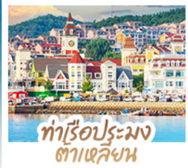
ทำเรือประมง ต้าเหลียน