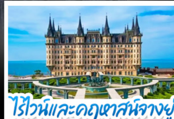
ไร่ไวน์และคฤหาสน์จางยู