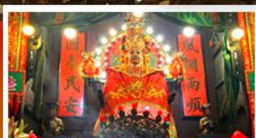
วัดเซกตงเหมียว