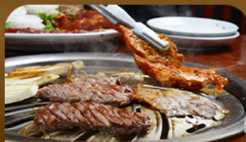
เมนูข้างสโตร์เกาหลี