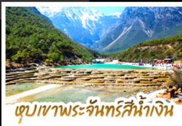
เขื่อนพระจันทร์สีน้ำเงิน