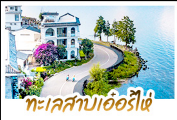
ทะเลสาบเอ๋อร์ไฮ่

นั่งรถม้าสุดฟิน ชมทุ่งข้าวสีทองเหลืองอร่าม • ถ่ายรูป MOOD ที่ใช้กับวิวทะเลสาบเอ๋อร์ไฮ่สุดโรแมนติก ชมดอกไม้ตามฤดูกาลกลางขุนเขา ณ สวนฮวงมู่ตาง • พิชิตภูเขาหิมะมังกรหยกความสูงกว่า 4,506 เมตร (รวมกระเช้าใหญ่ ไป-กลับ) • นั่งรถไฟชมวิวภูเขาหิมะมังกรหยกวิวพาโนรามา • จิบกาแฟยามบ่าย พร้อมจิบช็อคอิน วิวหลักล้าน ณ ร้านกาแฟหยุนต้ออัน (รวมค่าเครื่องดื่มท่านละ 1 แก้ว) • เที่ยวเมืองโบราณต้าหลี่ ลีเจีย ไปซา ชิม ซ้อป แชะ กับวัฒนธรรมยูนนาน • ช้อปปิ้งเพลิน ณ ถนนคนเดินหนานผิงเจียและ POP MART