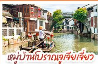
หมู่บ้านโบราณซูเจียงเจี๋ย

สวนสนุกเซี่ยงไฮ้ดิสนีย์แลนด์ เต็มวัน (รวมรถรับ-ส่ง)