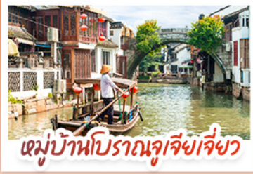
หมู่บ้านโบราณจูเจียเจี๋ย

สวนสนุกเซี่ยงไฮ้ดิสนีย์แลนด์ เต็มวัน (รวมรถรับ-ส่ง)