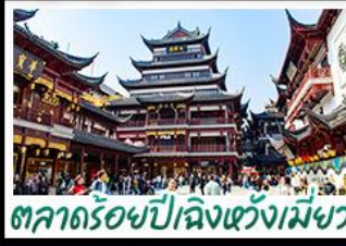
ตลาดร้อยปีเจียงหวงเมี่ย