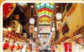
ตลาดปลา นิชิกิ