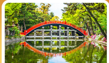
ศาลเจ้าสุมิโยชิ โกเบ