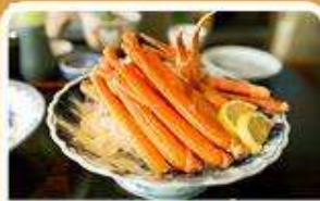
พิเศษ! ขาปู