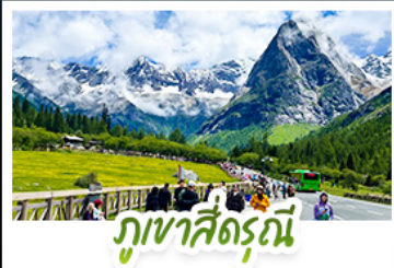
ภูเขาสี่ดรุณี

เที่ยวครบ 3 อุทยานชื่อดังแห่งมณฑลเสฉวน ชมวิวยอดเขาหิมะและธรรมชาติสุดอลังการ ณ อุทยานภูเขาสี่ดรุณี (ชื่อภูเขาหิมะ) อุทยานป่าผิงโกว เพลิดเพลินกับวิวทะเลสาบ ป่าสน และใบไม้เปลี่ยนสี อุทยานจิวจ้ายโกว มรดกโลกทางธรรมชาติ น้ำใสฟ้าราวภาพวาด สัมผัสประสบการณ์นั่งรถไฟความเร็วสูง