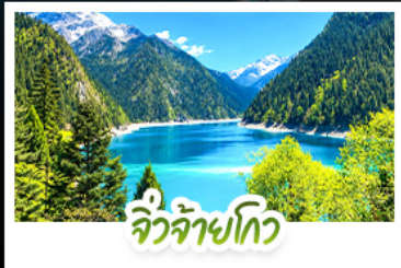
จิวจ้ายโกว