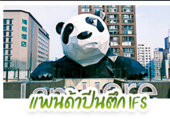
แพนด้าปิ่นตึก IFS