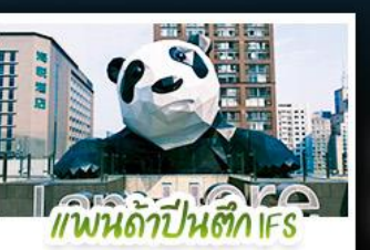
แพนด้าปิ่นตึก IFS