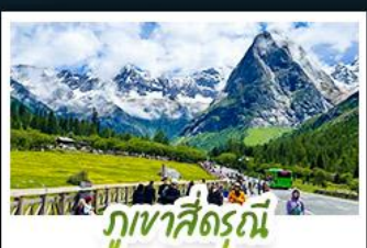
ภูเขาสีดรุณี