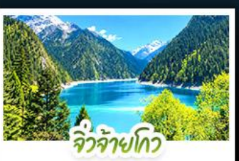
จิวจ้ายโกว