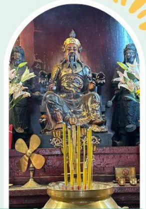
วัดปุกโตฮองฮำ