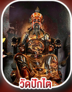
วัดบิกไต่