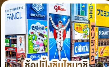
ซ้อปั้งชินโซบาชิ และโดตงโมริ