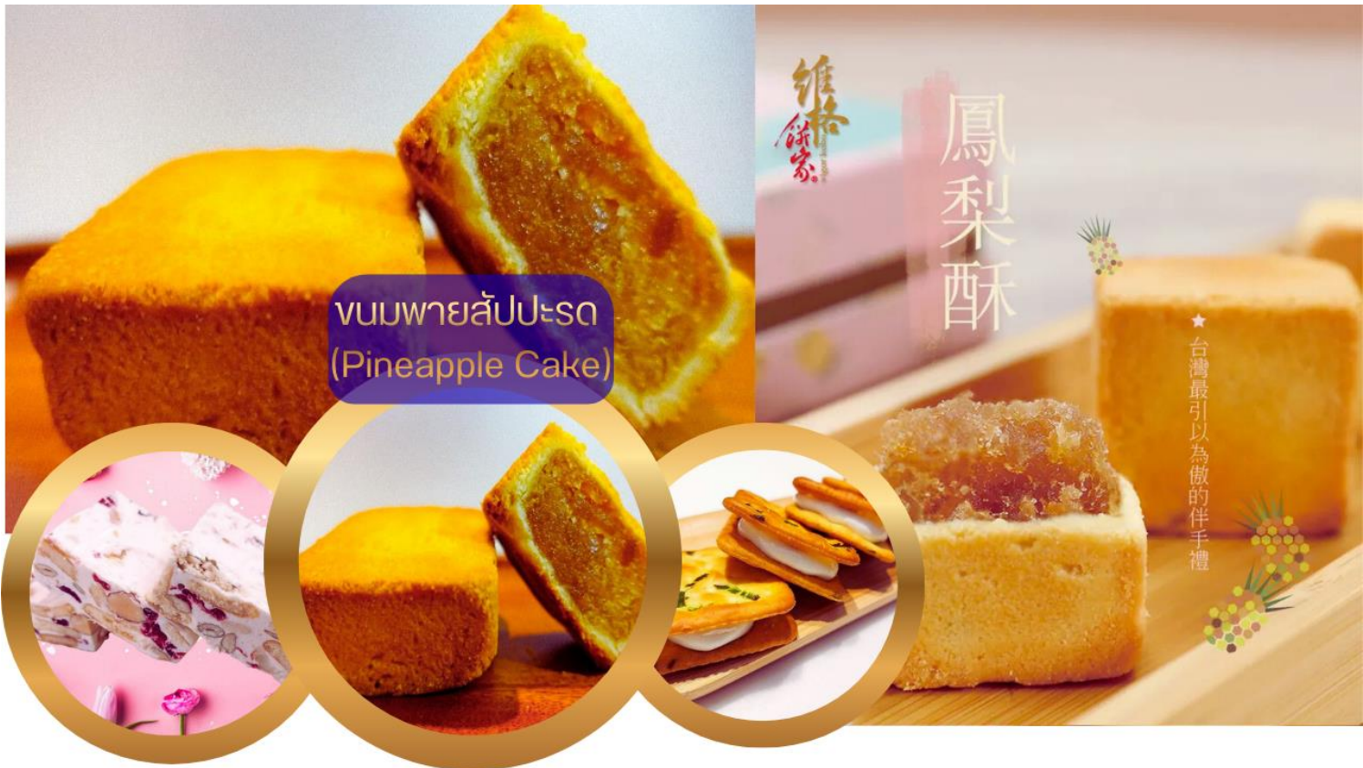
ขนมพายสับประรด (Pineapple Cake)