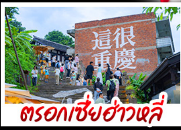
ตรอกซี่ย่าวหลี่