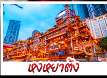
แดนหยาดัง