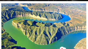
แกรนด์แคนยอนแม่น้ำเหลือง