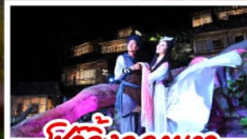
ซิ่วจิ้งจอกขาว