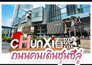
ชุนX 春熙 ถนนคนเดินชุนซู้