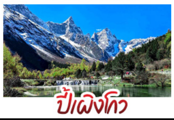
ปี่ผิงโกว