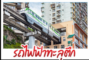
รถไฟฟ้าทะเลตุ๊ก