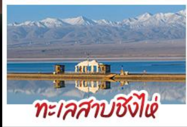
ทะเลสาบซิงไห่