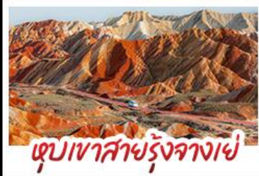
หุบเขาสายรุ้งจางเย่