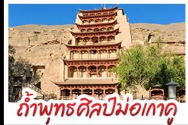
กำแพงพุทศสิลปม่อเกาคู

เป็นทราจครวญ - สระน้ำงพระจีนทร์ ทะเลสาบเกลือฉาซ่า - กำพุทศสิลปม่อเกาคู หุบเขาสายรุ้งจางเย่ - ทะเลสาบซิงไห่