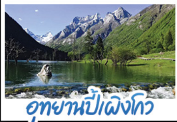
อุทยานปี้เฉิงโกว