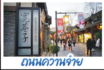
ถนนควานจ้าย