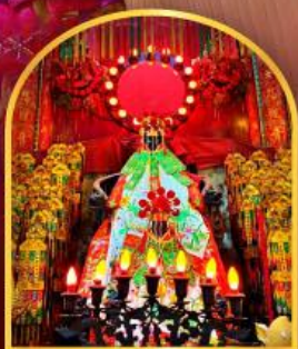
เจ้าแม่กวนอิมฮ่องกง ที่มีอายุกว่า 600 ปี