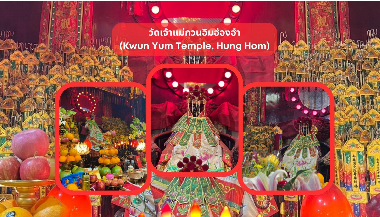
วัดเจ้าแม่กวนอิมฮ่องกง (Kwun Yum Temple, Hung Hom)

3. ให้เดินวนตามเข็มนาฬิกาอบเทพเจ้าไฉ่ซิงเอี้ยะทั้ง 5 องค์ จนครบ 3 รอบ ขณะที่เดินผ่านแต่ละองค์ให้ขอพรและไหว้ 3 ครั้ง เมื่อเดินจนครบให้กลับมายืนที่องค์ตรงกลาง บอกชื่อ-นามสกุล วัน/เดือน/ปี ที่มาไหว้ท่าน ตั้งจิตอธิษฐานขอพรมองไปที่ใบหน้าของท่าน