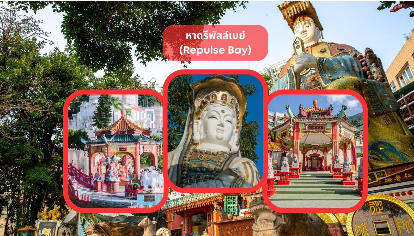
หาดรีพัลส์เบย์ (Repulse Bay)

รับประทานอาหารเช้า ณ ภัตตาคาร บริการท่านด้วยเมนูติ่มซำฮ่องกง (มื้อที่ 3)