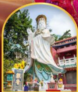
เจ้าแม่กวนอิม รัชลีสเบย์ ขอพรเกี่ยวกับธุรกิจ และ การเงิน