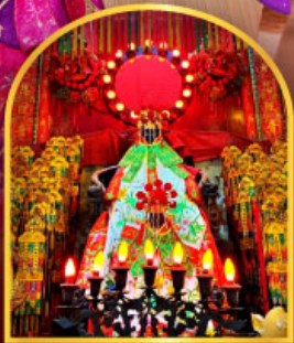
วัดหวังต้าเซียน ขอพรด้านสุขภาพ