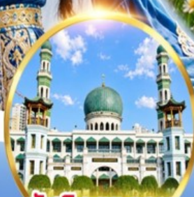
มัสยิดตงกวน