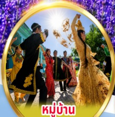
หมู่บ้าน วัฒนธรรมอุยกูร์

พิเศษ นั่งรถม้า + ซิมไอศกรีมอุยกูร์ ชมการแสดง