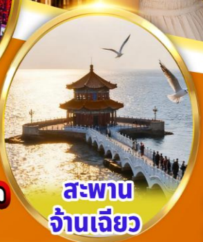
สะพาน จ้านเจียว