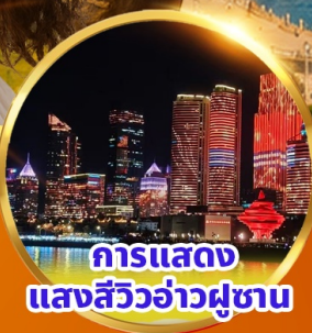
การแสดงแสงสีว้าวฟูซาน