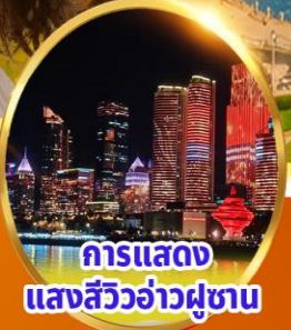
การแสดง แสงสีว้าวคู่ขนาน