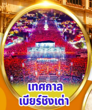
เทศกาล เบียร์ชิงเต่า