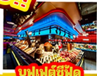
บุฟเฟ่ต์ชีฟูต