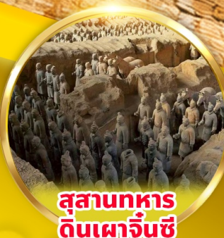
สุสานทหาร ดินเผาจีนซี