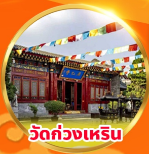
วัดกวางเหริน