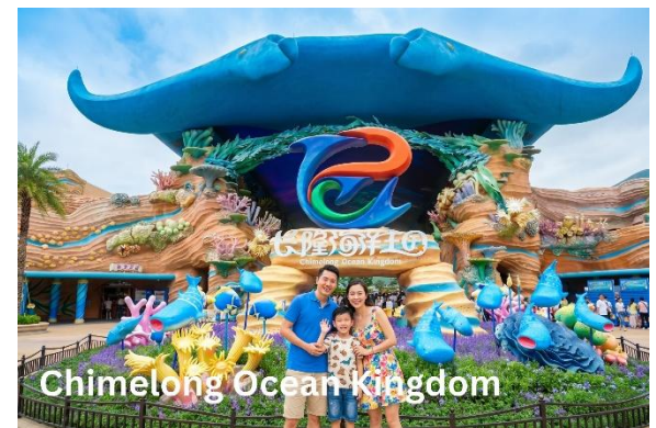
Chimelong Ocean Kingdom

อุโมงค์ใต้มหาสมุทร จอ LED ขนาดยักษ์ที่อยู่ด้านบนบนเหนือศีรษะ ให้ความรู้สึกเหมือนได้อยู่ใต้ท้องมหาสมุทรที่กว้างใหญ่ ได้เห็นถึงความอุดมสมบูรณ์ของระบบนิเวศใต้ท้องมหาสมุทร ความน่ารักของสัตว์น้ำต่างๆ หลากหลายสายพันธุ์ที่แหวกว่ายไปมาตามซอกปะการังสีสันสดใส