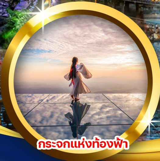
กระบอกแห่งท้องฟ้า