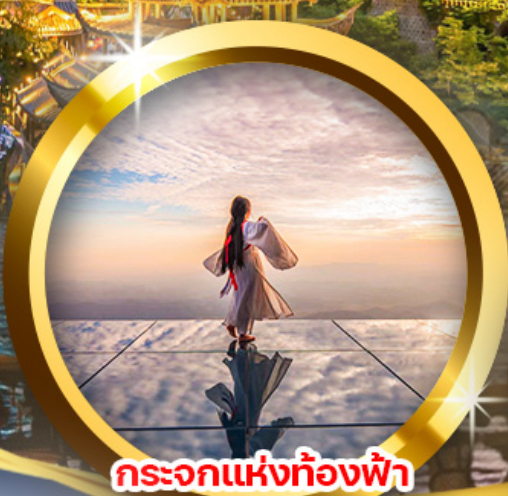
กระบอกแห่งท้องฟ้า