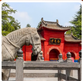
เจดีย์ม้าขาว