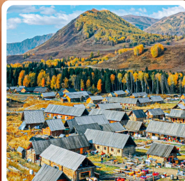
หมู่บ้านเหอจู