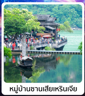
หมู่บ้านชาวน้ำเสี่ยเหรินเจีย