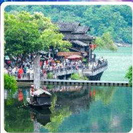
หมู่บ้านชาวน้ำเสี่ยเหรินเจีย