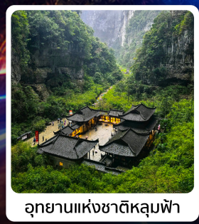
อุทยานแห่งชาติหลุมบ่อฟ้า

ไอโกล์! อุทยานแห่งชาติหลุมบ่อฟ้า มรดกโลกระดับ 5A รถไฟฟ้าทะลุติ๊ก ตึกตะเกียบ อลังการแสงสีหงหยาดตั้ง