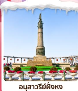
อนุสาวรีย์ผิงหง