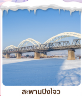
สะพานปิงโจว