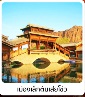
เมืองเล็กตันเสี่ยโซ่ว