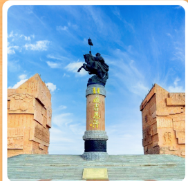
เขตท่องเที่ยวเจงกิสข่าน

ไฮไลท์ทะเลทรายอินเคินทาลา เขตท่องเที่ยวเจงกิสข่าน ทำเนียบพระลามะอูหลาน ตลาดตอนกลางคืนเมืองตาลาเต๋อ