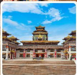
ทำเนียบพระลามะอูหลาน