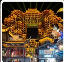
ตี๊กหัตจอร์รี่ 72