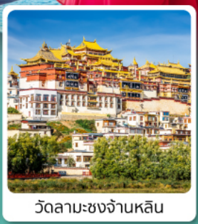
วัดลามะซงจ้านหลิน