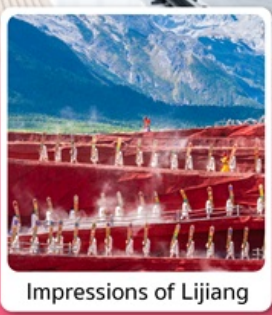
Impressions of Lijiang