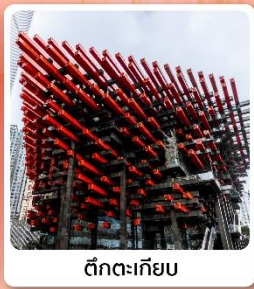
ตึกทะเลียม