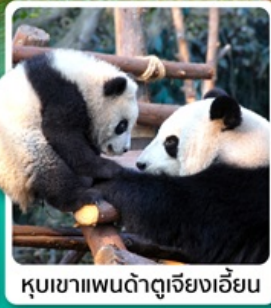
หุบเขาแพนด้าตู่เจียงเอี้ยน