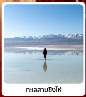
🌊 ทะเลสาบซิงไห่