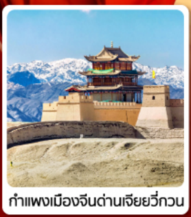
🏰 กำแพงเมืองจีนด่านเจียหยวี่กวน

🌐 • ทั่วโลก...เส้นทางสายไหม ชมสระน้ำงพระจันทร์ ทะเลทรายหมิงซาซาน กำแพงเมืองจีนด่านสุดท้าย "เจียหยวี่กวน" มรดกโลกภูเขาสายรุ้งจางหย่