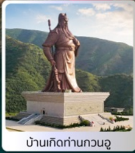
บ้านเกิดท่านกวนอู